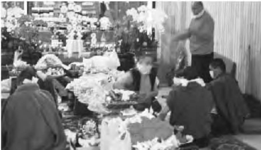
諸位喇嘛於二樓壇城將各種裝臟寶物進行包裝

行，要每個人帶著口罩避免污染裝臟物，並叮囑在過程中要發願祈禱，而且要發大願，願一切眾生都能離苦得樂、究竟成佛，而不要發我希望怎樣怎樣、這輩子要如何如何的世間小願，因為小願都含攝在大願之中，不需再特別強調了。