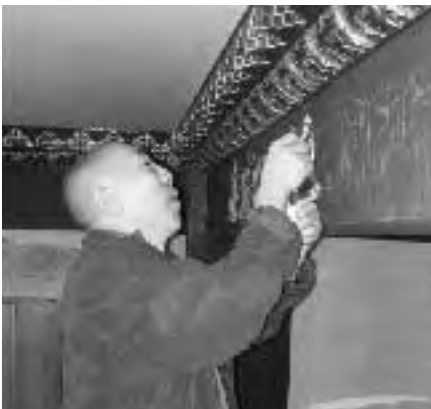
喇嘛甘蔣為大殿樑柱紋飾描繪底圖

打從喇嘛雕刻保麗龍開始將近半年的時間，金法林的工程如火如荼地進行，而週末晚上中心的共修仍然持續不斷，十月初還依往例在石碇達香寺舉辦大藏經持誦法會及朝山拜塔活動，十月中喇嘛江秋亦帶團前往米麗寺，參加波卡仁波切圓寂週年普賢行願法會。不管喇嘛是否在台灣，每逢假日都有師兄自行上山幫忙。