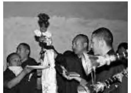
喇嘛朝鏡中大佛影像淋上甘露水，象徵為大佛沐浴

儀式結束後喇嘛感謝大家的參與。有人問：「現在可以頂禮大佛了嗎？」，喇嘛回答：「可以了可以了！」，大家便各自找個角落躬身下跪磕頭行禮，有些師兄向大佛獻上哈達，有些則端來多盞蘇油燈讓大家點燈供佛。人群圍繞在大佛旁久久不散，瞻仰凝視目不捨離，或向身旁的人述說大佛的莊嚴和內心的感動，並讚美喇嘛高超的手藝。有位高師兄轉身對我說：「從沒見過一尊佛像笑的像眼前尊如此開心。」於是我再看一眼，覺得真的耶！不過不知是不是因為寶島上學佛的人越來越多，所以才開心地笑了呢！